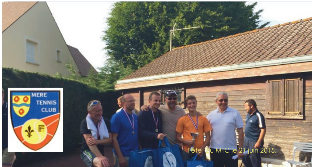
Fête du MTC le 21 juin 2015.